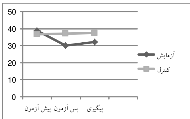
نمودار ۱: تغییرات تعارض و سردرگمی

در زیرمقیاس تعارض و سردرگمی، نتایج نشان می‌دهد که در مقایسه پیش آزمون - پس آزمون در دو گروه مقایسه و آزمایش تغییرات معنادار است، یعنی کاهش میانگین نمرات تعارض و سردرگمی در گروه آزمایش (پیش آزمون = ۳۸/۹۵ و پس آزمون = ۳۰/۱۴) معنادار است و در مقابل تغییر نمرات در گروه مقایسه (پیش آزمون = ۳۶/۸۰ و پس آزمون = ۳۷/۰۵) معنادار نیست و می‌توان این کاهش معنادار را به متغیر مستقل (آموزش والدین مبتنی بر نظریه دلبستگی) مربوط دانست. عدم معناداری تفاوت‌های مشاهده‌شده در پیگیری (آزمایش = ۳۲/۱۹ و مقایسه = ۳۷/۵۰) بدین معناست که کاهش تعارض و سردرگمی در گروه آزمایش در طول زمان باقی مانده است ( F=2/47 و P=0/124 ).