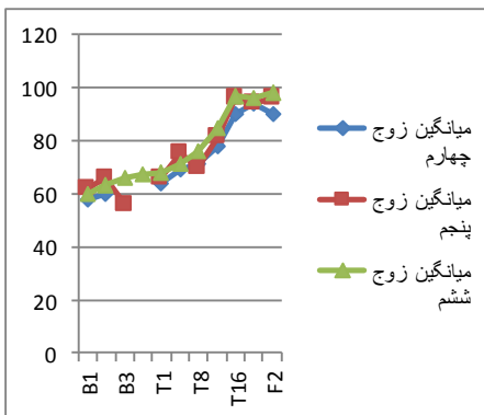
نمودار ۴. روند تغییر نمره‌های مقیاس صمیمیت زناشویی در مراحل خط پایه، مداخله و پیگیری سه زوج گروه زوج‌درمانی متمرکز بر درمان رفتاری تلفیقی

متغیر صمیمیت زناشویی در مرحلهٔ پس از درمان بهبودی نشان داده‌اند. مقدار شاخص تغییر پایایی به دست‌آمده برای زوج اول و دوم و سوم، در مرحلهٔ پس از درمان ۲/۸۴، ۲/۹۵ و ۲/۱۴ و در مرحلهٔ پس از پیگیری ۲/۰۶، ۲/۴۲ و ۲/۳۳ بود که این مقادیر در سطح P < 0/05 معنادار است. مقدار شاخص تغییر پایایی به دست‌آمده برای زوج چهارم و پنجم و ششم، در مرحلهٔ پس از درمان ۱/۹۹، ۲/۰۶ و ۱/۹۷ و در مرحلهٔ پس از پیگیری ۱/۹۹، ۱/۹۷ و ۱/۹۹ بود که این مقادیر در سطح P < 0/05 معنادار است. بر اساس درصد بهبودی کلی می‌توان گفت که درمان گاتمن با ۳۹/۶۵ درصد بهبودی، اثربخشی بیشتری نسبت به گروه زوج‌درمانی رفتاری - تلفیقی با ۳۴/۹۷ درصد بهبودی، بر متغیر صمیمیت زناشویی نشان داده است.