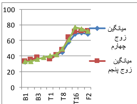
نمودار ۲. روند تغییر نمره‌های کیفیت روابط زناشویی در مراحل خط پایه، مداخله و پیگیری سه زوج گروه زوج‌درمانی، متمرکز بر درمان رفتاری - تلفیقی

نتایج جدول ۳ نشان می‌دهد که میزان بهبودی کلی در مراحل پس از درمان و پیگیری در گروه گاتمن به ترتیب، ۳۷/۱۵ و ۴۹/۵۳؛ این میزان (بهبودی کلی) در گروه رفتاری - تلفیقی در مراحل پس از درمان و پیگیری به ترتیب، ۳۳/۱۰ و ۴۳/۶۸ درصد بود. یافته‌ها بیانگر این بود که این میزان بهبودی در پایان مراحل دومانه پیگیری، در گروه گاتمن ۱۳/۴۱ صدم و در گروه رفتاری - تلفیقی ۱۰/۵۸ صدم افزایش یافته است. اگرچه زوج‌های تحت درمان زوج‌درمانی رفتاری - تلفیقی نسبت به زوج‌درمانی گاتمن بهبودی کمتری نشان دادند، همه آزمودنی‌های گروه زوج‌درمانی رفتاری - تلفیقی به سطح معناداری بالینی دست یافتند. می‌توان گفت که هر شش زوج تحت درمان روش گاتمن و روش رفتاری - تلفیقی در متغیر کیفیت رابطه زناشویی، در مرحله پس از درمان بهبودی نشان داده‌اند. مقدار شاخص تغییر پایا به دست آمده برای زوج اول و دوم و سوم، در مرحله پس از درمان ۲/۱۶ و ۲/۱۴ و در مرحله پس از پیگیری ۳/۴۱، ۳/۵۶ و ۳/۲۱ بود که این مقادیر در سطح P < 0.05 معنادار است. مقدار شاخص تغییر پایا به دست آمده برای زوج چهارم و پنجم و ششم، در مرحله پس از درمان ۱/۹۸، ۲/۴۴ و ۲/۲۷ و در مرحله پیگیری ۳/۱۸، ۳/۳۰ و ۳/۱۵ بود که این مقادیر در سطح P < 0.05 معنادار است. با توجه به بالا بودن نمرات هر شش زوج از نقطه برش پرسش‌نامه کیفیت رابطه زناشویی (۵۳/۴) می‌توان گفت که تغییرات از نظر بالینی معنادار است.