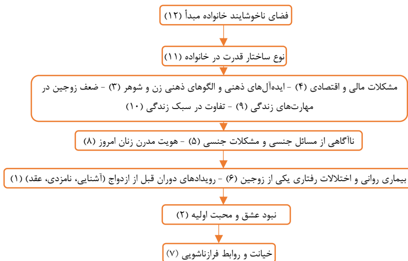
شکل ۱: عوامل مؤثر بر تعارضات اولیه زناشویی

تعارضات، با بیشترین نفوذ شناخته شد. عامل «خیانت و روابط فرازناشویی» در سطح اول با بیشترین وابستگی قرار گرفت.